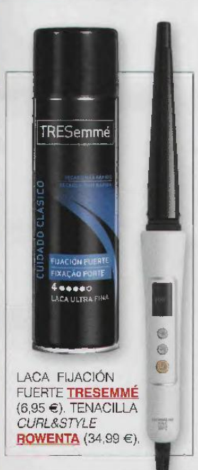
LACA FIJACIÓN FUERTE TRESEMMÉ (6,95 €). TENACILLA CURL&STYLE BOWENTA (34,99 €).