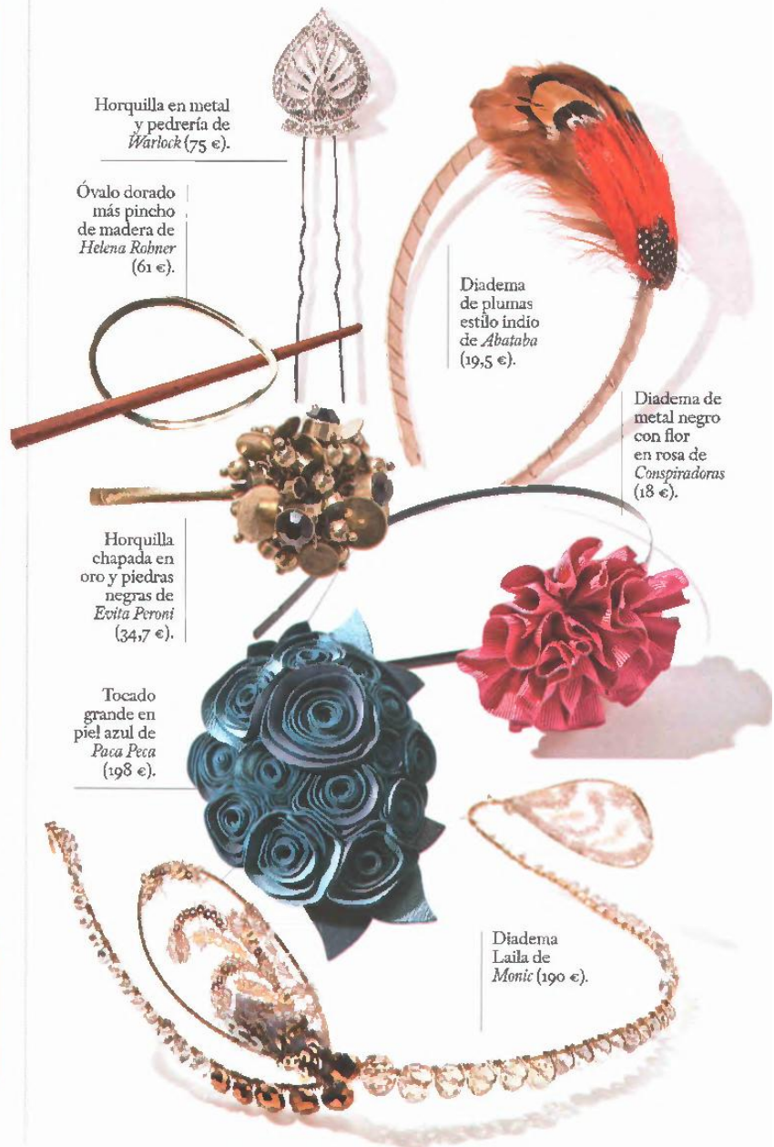
Horquilla en metal y pedrería de Warlock (75 €).