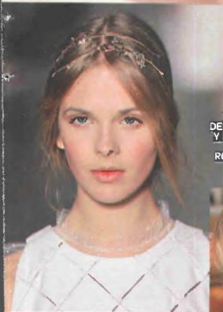
DE IZQUIERDA A DERECHA, FRENTE Y ESPALDA DE UN PEINADO DE RODARTE Y OTRO DE VALENTINO